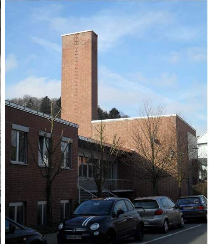
ZEMA - ZENTRUM FÜR MECHATRONIK UND AUTOMATISIERUNGSTECHNIK GEMEINNÜTZIGE GMBH