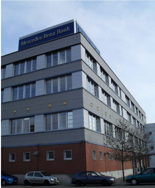
MERCEDES BENZ BANK