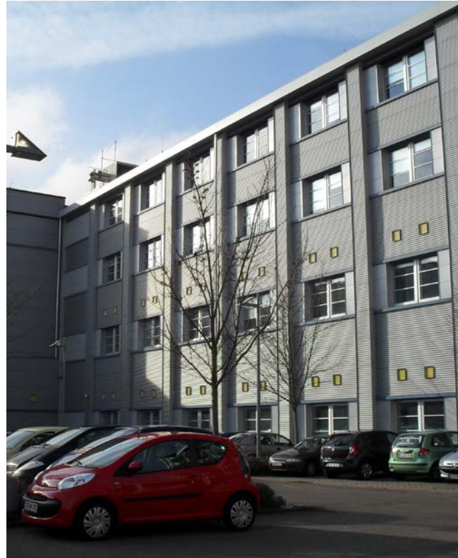
UNION KRANKENVERSICHERUNGS AG